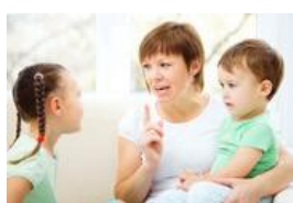
Ребенок ни в коем случае

ликты со сверстниками, поскольку у них не развиты навыки самоограничения. Особую неприязнь они вызывают тем, что по всякому пустяку жалуются взрослым. Они преувеличенно чувствительны, громко плачут, обвиняют всех в несправедливости, а в отношении себя они очень снисходительны.