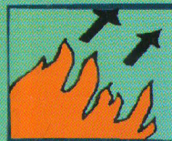
Определите направление распространения огня