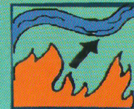
Выберите маршрут выхода из леса в безопасное место