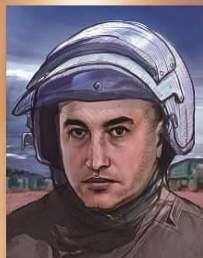
СЕРГЕЙ ПАНОВ Гвардии майор, награжден посмертно