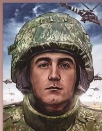
СЕРГЕЙ СУХАРЕВ Гвардии полковник, награжден посмертно