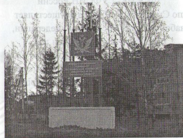
ФКУ ИК-2 УФСИН России по Смоленской области

Для поступления требуется: ЕГЭ (по трем предметам в зависимости от специальности), дополнительно пройти военно-врачебную комиссию, испытания по физической подготовке и профильному предмету в соответствии со специальностью.