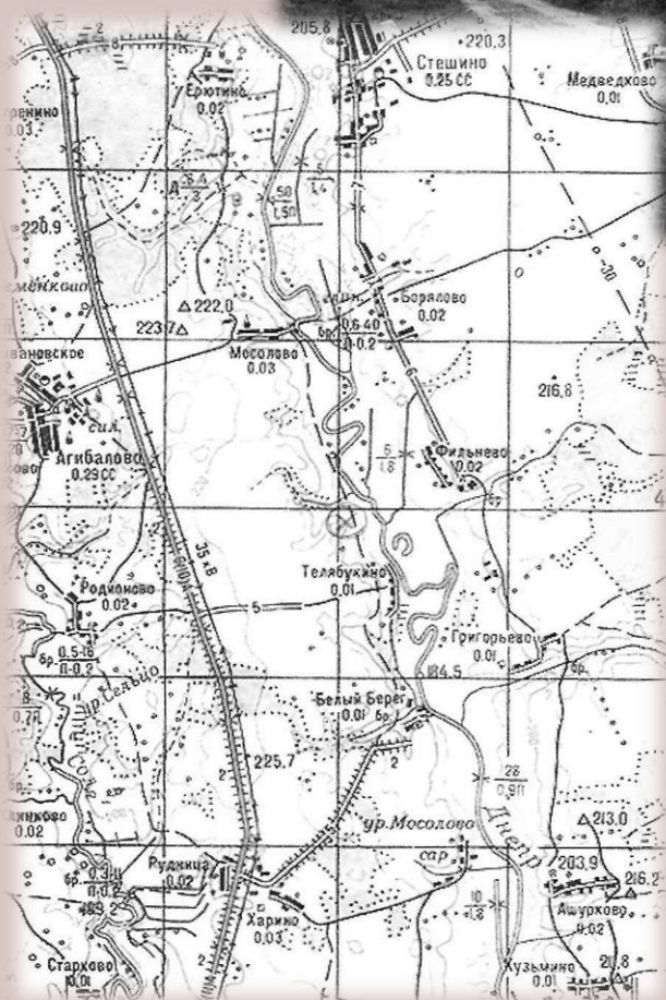
Карта 1986 года.