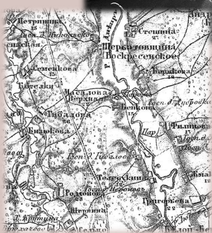
Карта 1871 года.